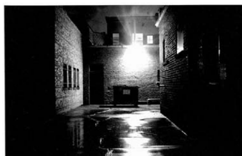
Enge plekken mijden

Vergeleken met voorgaande jaren is er een afname van het aantal mensen dat bepaalde plekken in Tiel mijdt (van 33% naar 24%). Aan de andere kant voelen deze mensen zich wel vaker onveilig (16% voelde zich in 2005 vaak onveilig, in 2007 is dit 25%). Verder zijn er geen noemenswaardige veranderingen opgetreden in de onveiligheidsgevoelens in eigen buurt.