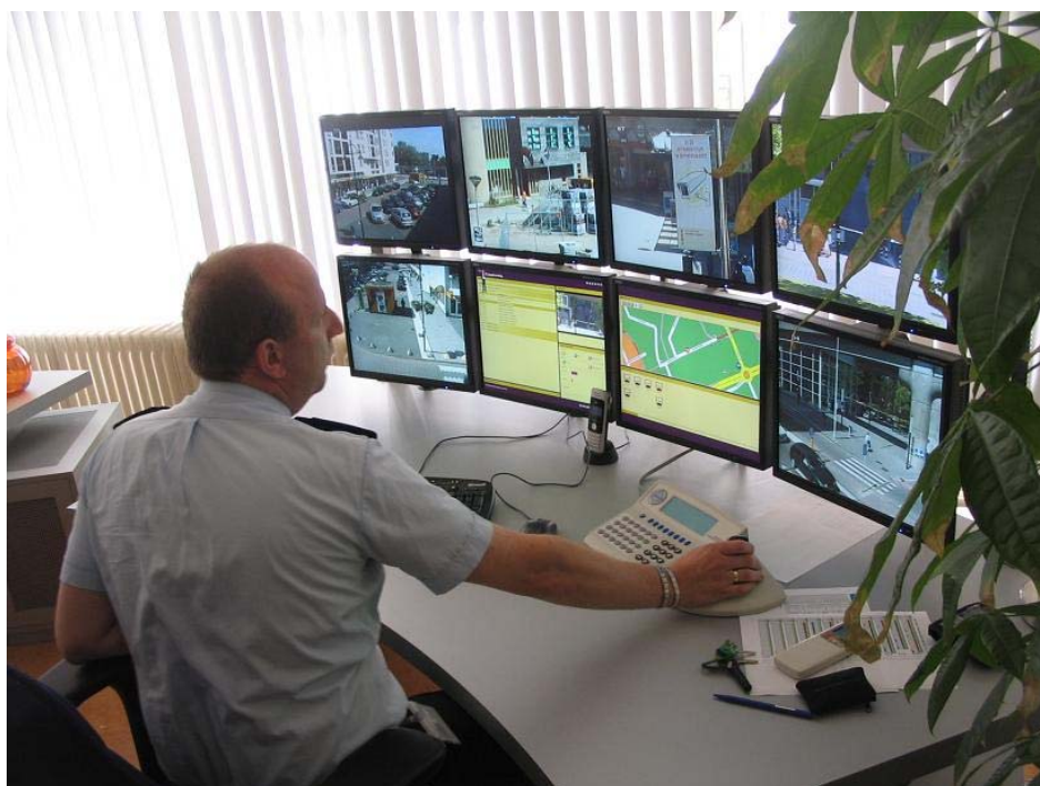
Toezichtcentrale op het Bijlmerplein