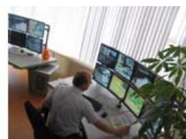
Vier toezichtcentrales Amsterdam-Amstelland