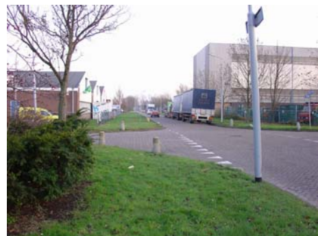
Parkeren dicht bij bocht