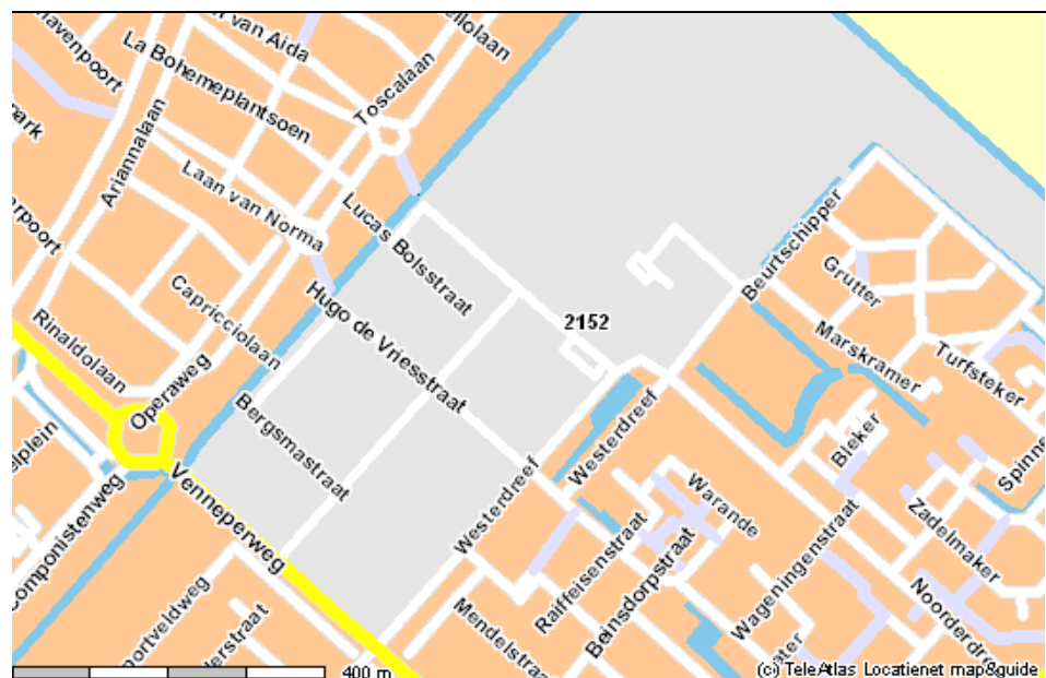
Kaart De Pionier

De Pionier is gesitueerd tussen de Vennepeweg in het zuiden en de Lucas Bolsstraat in het noorden. De Nieuwerkerktocht ligt aan de westelijke grens van het bedrijventerrein en de Westerdreef aan de oostelijke kant. Het plangebied voor de gemeentelijke herstructurering beperkt zicht tot de Staringstraat, de Hugo de Vriesstraat, de Bergsmastraat en de Kopsstraat. De straten aan de rand, Vennepeweg, Nieuwerkerktocht, Lucas Bolsstraat en Westerdreef en het Bolsterrein maken geen deel uit van het herstructureringsgebied maar worden wel meegenomen in deze veiligheidsscan.