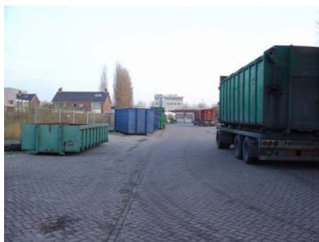
Container + oplegger op de openbare weg