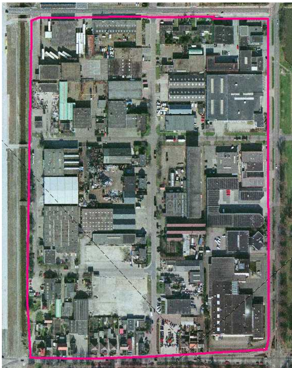
Kaart van het plangebied voor de herstructurering De Pionier