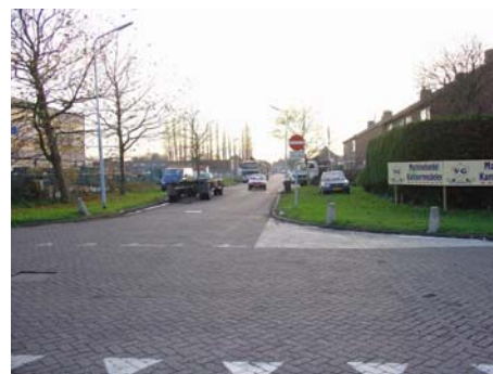
Hier wordt het eenrichtingsverkeer vaak geschonden, ook: parkeren op groenstrook