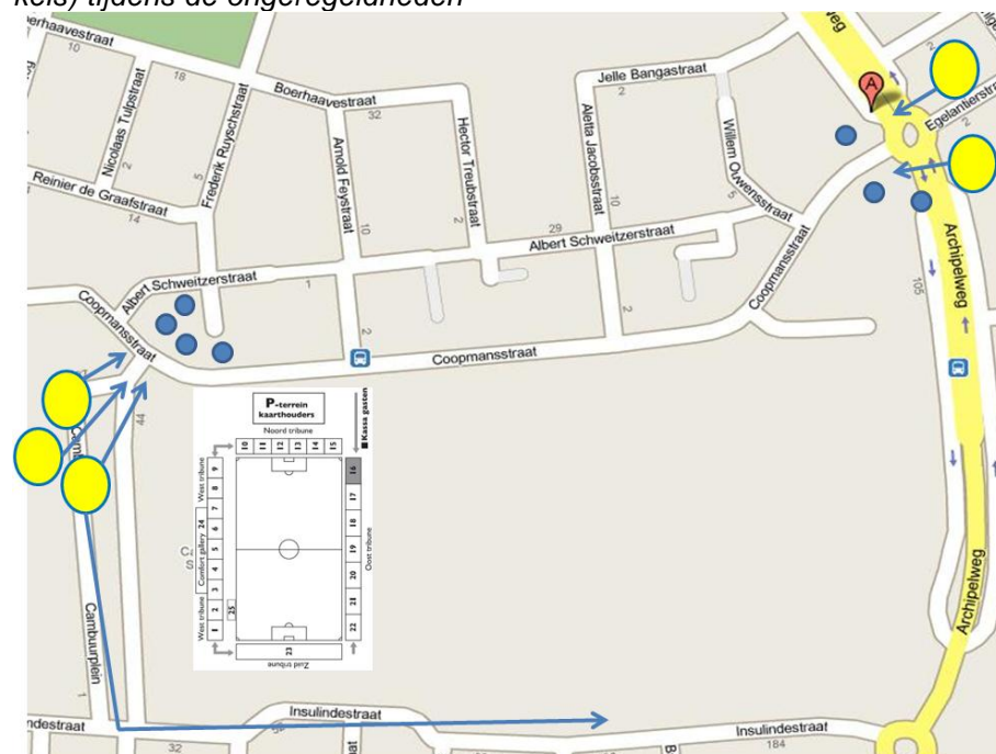
Afbeelding 5: Positionering ME (blauwe cirkels) en relschoppers (gele cirkels) tijdens de ongeregelde heden

Ondertussen blijft de sectiecommandant van de groep, die optreedt bij het Cambuurplein, doorgeven 'dat zij de situatie niet langer houden'.