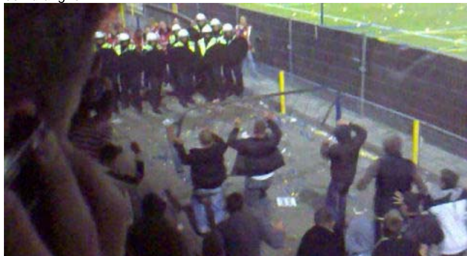
Afbeelding 4: Supporters van SC Cambuur Leeuwarden belagen de ME met een dranghek

Bij de ongeregelde heden is een beveiliging gewond geraakt. De beveiliging is uiteindelijk naar het uitvak gebracht en voor een hek tussen het uitvak en de oosttribune neergelegd. De club had namelijk al een ambulance gebeld en deze moest, conform het calamiteitenplan, aanrijden via de achterkant van