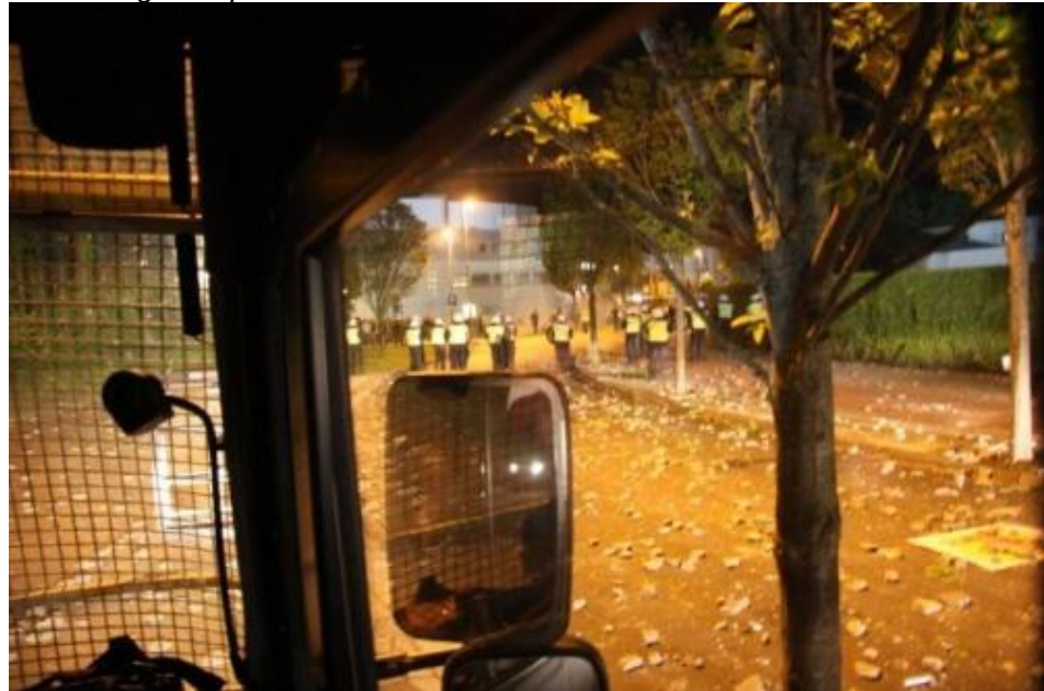
Afbeelding 6: Impressie van de rellen buiten het stadion

Nadat de rellen bij het Cambuurplein/Coopmansstraat zijn opgehouden, stuurt de commandant van de ME een groep naar de rotonde Coopmansstraat/Archipelweg omdat de spelersbus van Roda JC nog moest vertrekken. Uiteindelijk is ook de spelersbus van Roda JC om 01.10 uur zonder problemen vertrokken.