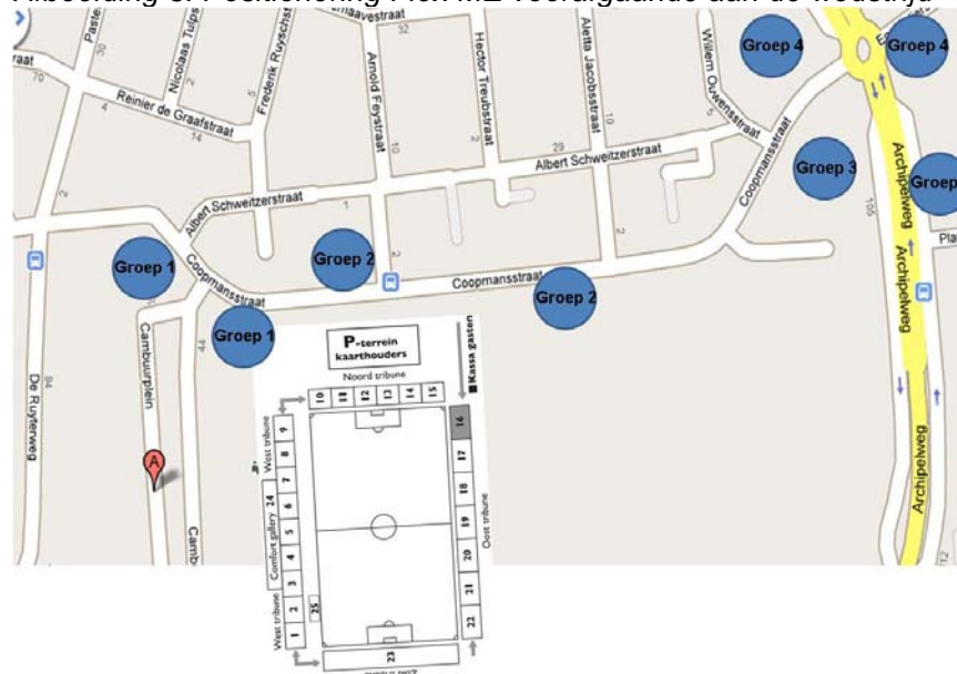
Afbeelding 3: Positionering Flex ME voorafgaande aan de wedstrijd

De politie in Leeuwarden heeft een gedeelte van de Coopmansstraat achter de Noordtribune afgezet, zodat de bussen van Roda JC zonder problemen kunnen arriveren. Bij aankomst wordt het eerste cluster supporters van Roda JC in het stadion geprovoceerd door supporters van de Oosttribune. Dat gebeurde in de hoek tussen de vak 15 (bezoekersvak) en vak 16 (Oosttribune). Stewards van SC Cambuur Leeuwarden treden hier niet direct tegen op. Bij aankomst van het tweede cluster worden de supporters van Roda JC dermate geprovoceerd door jonge supporters van de Oosttribune, dat deze verhaal willen gaan halen. Er ontstaan schermutselingen waarbij een steward van Roda JC letsel oploopt aan zijn hand.