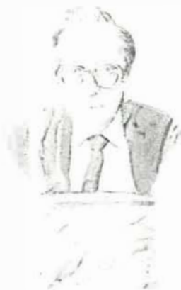
Tekening: Hans Sprangers

De tiende editie van de Hein Roethofprijs kent dit jaar een dubbele winnaar: Halen en Haarlem sleepten de hoofdprijs in de wacht.