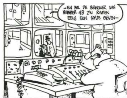
Illustratie: Wim Steenhagen

Centraal in de effectevaluatie staat de vraag of videobewaking een positieve invloed heeft op de criminaliteit en de veiligheidsbeleving en daarmee de algemene leefbaarheid in de flat vergroot. Voorafgaand aan het project en één jaar na aanvang zijn alle bewoners van de flat Kikkenstein en van twee nabijgelegen controleflats benaderd. Na één jaar wijzen de signalen de goede kant op. Kikkenstein scoort bij de tweede meting in april 1996 op vrijwel alle onderzochte aspecten positiever dan in 1995 en dan beide andere flats.