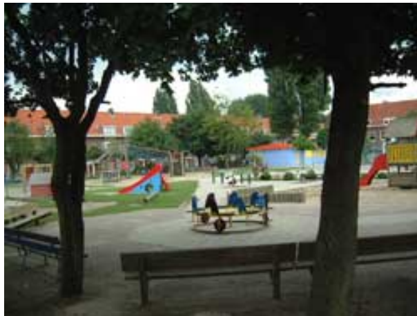
Speeltuin Mariotteplein Amsterdam (de vereniging is verdwenen)

Sociale cohesie in buurt en wijk, Wmo, Vinex, herstructurering, nieuwe tuinen/verenigingen, veiligheid, structuurvisie ..... voor wie zich even door het jargon worstelt, zijn er meer dan genoeg nieuwe kansen die ingekopt kunnen en moeten worden. Maar dan is wel een betere aanpak vereist. Een aanpak die veel kan leren van de marketing. Daarbij wordt allereerst gekeken waar het product 'sociale speelruimte van en voor de buurt' het meeste nodig is. Vervolgens moet er letterlijk een premie bestaan voor speelruimte, een premie op spelen, maar vooral een premie om mensen in een buurt (weer) actief te krijgen, samen dingen te laten doen: de Gerrit Zonnenberg premie.