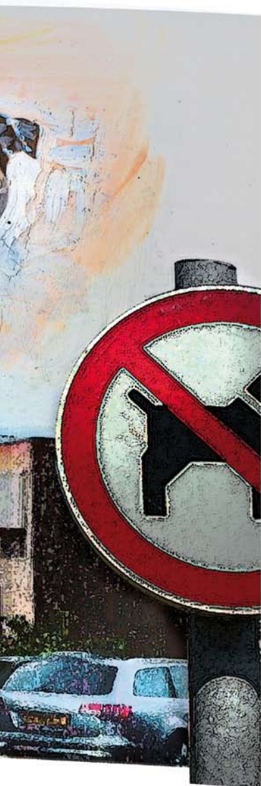
Illustratie: Hans Sprangers

Loslopende honden, hondenpoep op straat, wildplassen. Gemeenten kunnen met de bestuurlijke strafbeschikking overlast zelf handhavers inzetten om op te treden tegen dit soort problemen. Onderzoeker Sander Flight concludeert dat de kwaliteit van handhaving en van handhavers door de bestuurlijke strafbeschikking een impuls heeft gekregen.