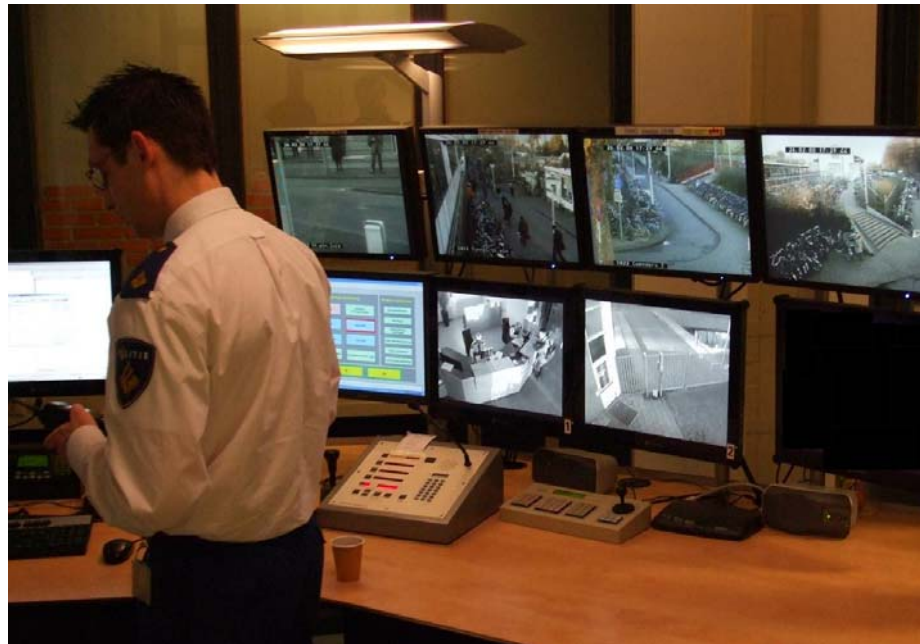
De beeldschermen op politiebureau Delft waar alle beelden van de geïntegreerde monitor centrale (GMC) van de regio Haaglanden kunnen worden getoond

In dit hoofdstuk gaat het echter over de output van cameratoezicht en daarbij speelt dit probleem veel minder sterk. Met output bedoelen we alle resultaten die het cameratoezicht direct heeft opgeleverd. We kijken naar de opbrengsten achter de schermen: hoe goed werkt het live toezicht, hoeveel incidenten worden er waargenomen en hoe vaak worden opgenomen beelden gebruikt voor opsporing achteraf?