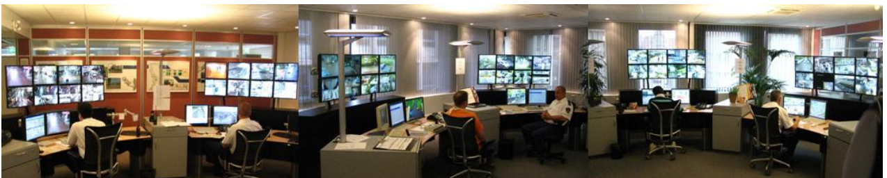
De geïntegreerde monitor centrale (GMC) van de regio Haaglanden – op één van de zes werkplekken worden de beelden van de camera's in Delft continu getoond

In bijzondere gevallen, zoals tijdens grote evenementen, worden de camerabeelden door bureau Delft zelf live bekeken. Als een incident niet live is waargenomen, maar er is wel behoefte aan de opgenomen beelden, dan kan bureau Delft tot maximaal zeven dagen na het incident de beelden opvragen bij de GMC. Daarna worden de beelden automatisch gewist.