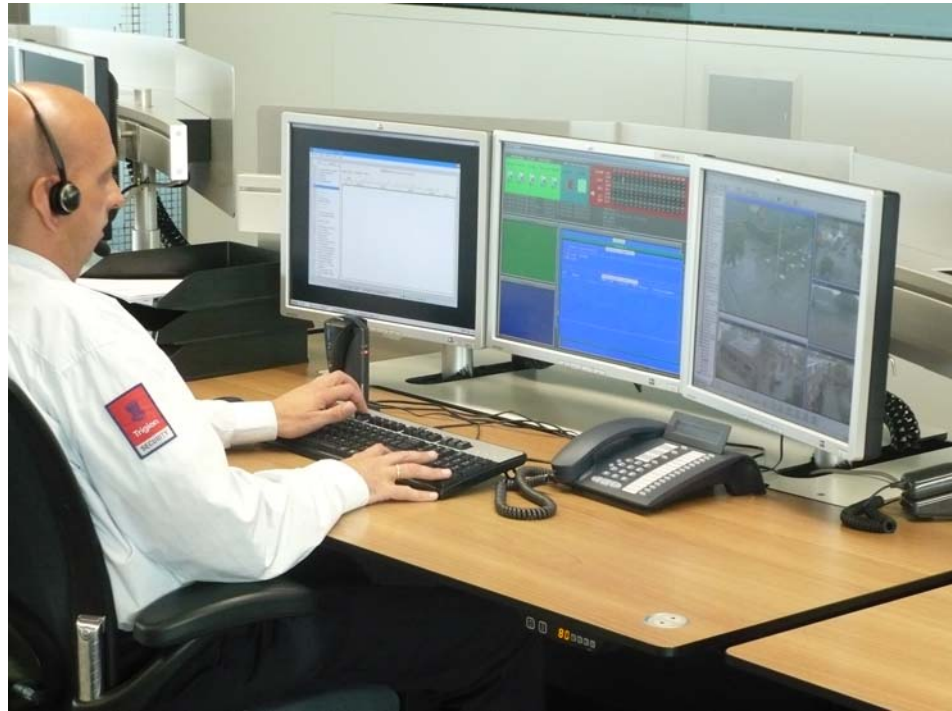
Toezichtcentrale van Trigion in Schiedam

De centralisten beschikken over de basisopleiding voor beveiliging en de basisopleiding centralist algemeen (BOCA). De huidige centralisten zijn echter niet in het cameragebied rondgeleid, ondanks het feit dat dit wel de afspraak was. (In de pilotfase in 2005 heeft bij aanvang wel een rondleiding plaatsgevonden.) Ook nieuwe centralisten worden niet rondgeleid waardoor de vraag opkomt in hoeverre zij het gebied goed genoeg kennen om effectief toezicht te kunnen houden.