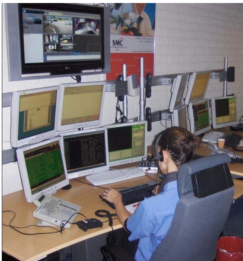
Toezichtscentrale SMC te Tiel