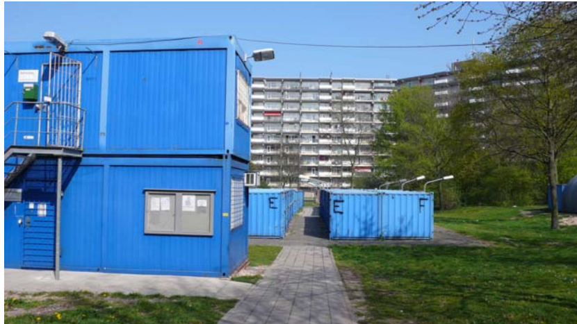
Renovatie Hakfort en Huigenbos