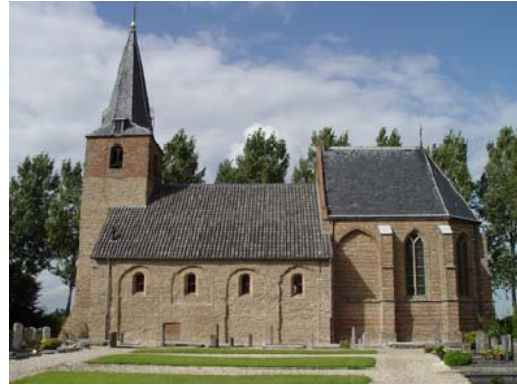
Kerk in Wadenoijen

De politie wordt in 2005 iets positiever beoordeeld dan in 2003: 61 procent is (zeer) tevreden over het totale functioneren van de politie in de eigen buurt. In 2003 was dat nog 56 procent.