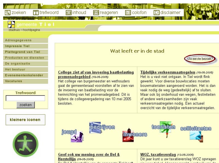
Website gemeente Tiel

De tevredenheid over de Zaak van de Stad en de dienstverlening door het Stadhuis is zeer groot. Maar liefst 91 procent is (zeer) tevreden. Ook Tiel Actueel en de gemeentelijke website scoren hoog met 81 procent tevredenheid. Bewonersbrieven en brochures worden iets minder gewaardeerd, maar nog altijd is een ruime meerderheid (zeer) tevreden (70%). De afhandeling van klachten leidt tot relatief veel ontevredenheid: slechts 42 procent is hier (zeer) tevreden over.