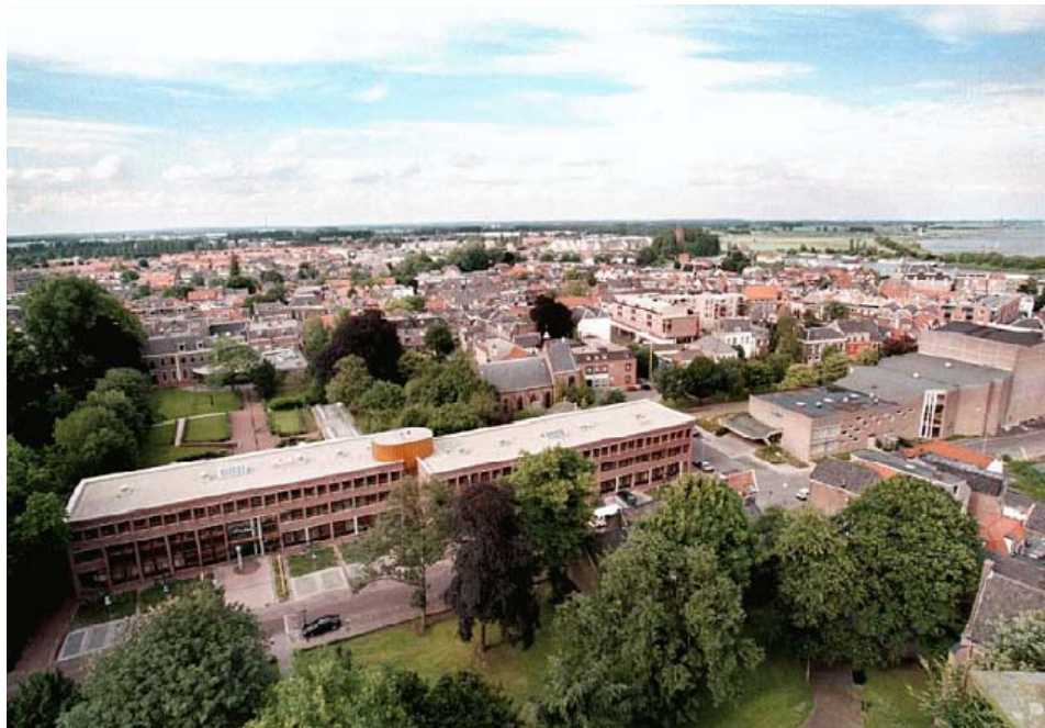
Stadhuis aan de Achterweg

De uitkomsten van dit onderzoek worden in twee aparte rapporten gepresenteerd: een tabellenboek dat alle antwoorden per wijk bevat en dit tekstrapport waarin de belangrijkste uitkomsten worden besproken. Het tekstrapport streeft niet naar volledigheid: het is bedoeld voor diegenen die snel inzicht willen in de huidige stand van zaken, de ontwikkelingen tussen 2003 en 2005 en de grootste verschillen tussen de wijken. Lezers die gedetailleerde informatie willen, kunnen in het tabellenboek terecht. In het tabellenboek wordt ook ingegaan op de betrouwbaarheid van de resultaten.