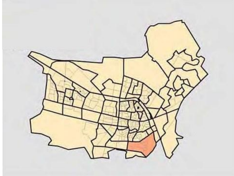
Tilburg met wijk Groenewoud (rood)