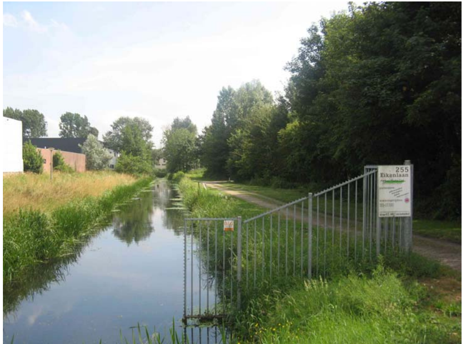
De ingang van de hondenclub ligt naast een doorgaande ecologische verbindingzone