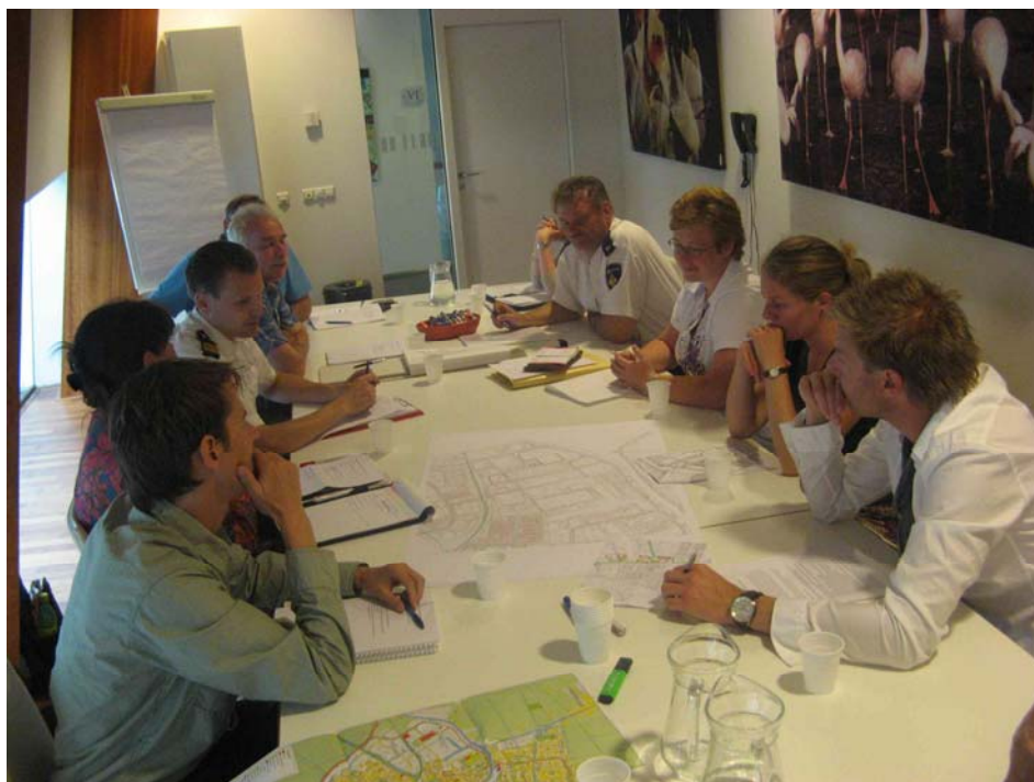
Bijeenkomst van de VER-werkgroep