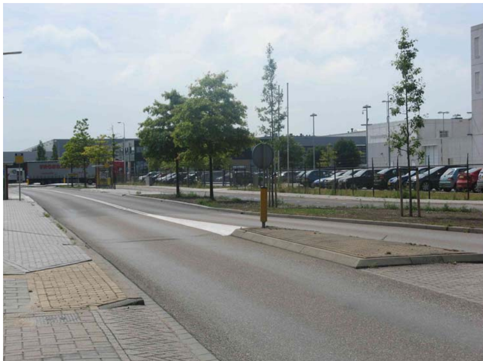
Bushalte voor de deur bij locatie 4