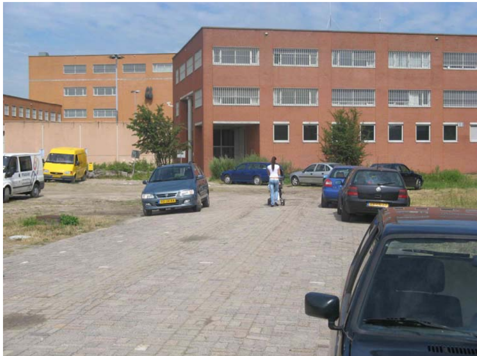
De penitentiaire inrichting ligt pal naast locatie 3