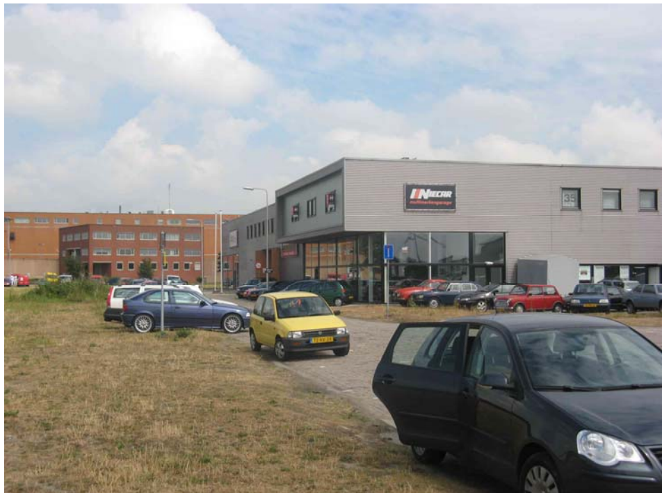
Relatief kwetsbare bedrijven, zoals dat van Niecar met zijn glazen pui, naast locatie 1