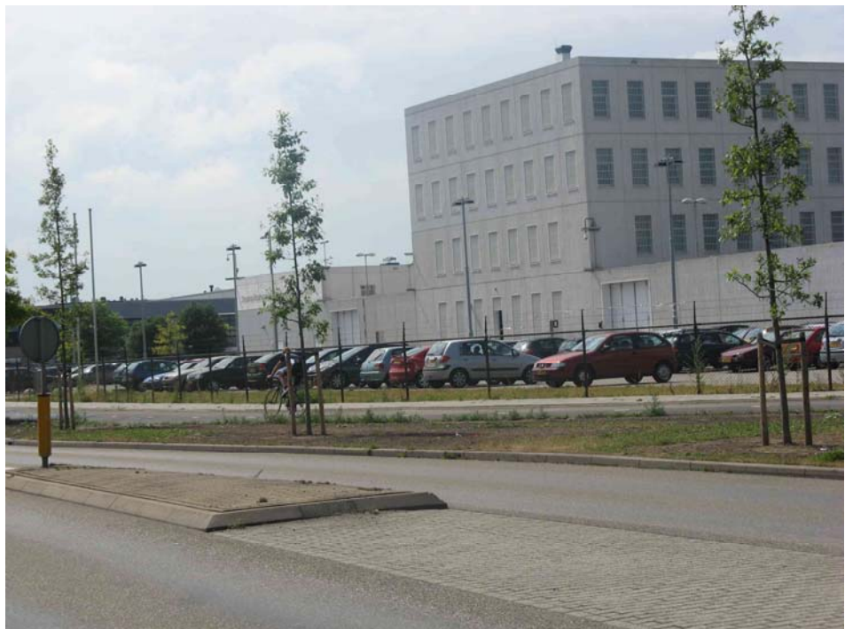
Detentiecentrum aan de Eikenlaan, recht tegenover locatie 4