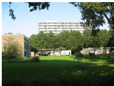
Gebied tussen de flats en huizen is groen maar wel saai en donker