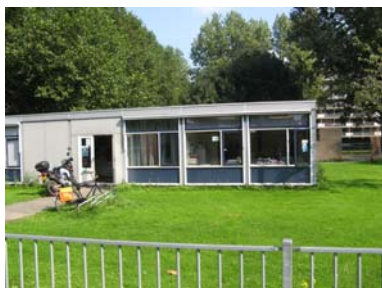
Buurthuis en ruimte van Stichting Welzijn spelen een belangrijke rol in de buurt