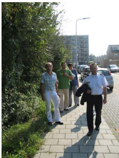
Schouwen met de leden van de VER-werkgroep

In de bijlagen, opgenomen in een los rapport, staan tenslotte de leden van de werkgroep VER, de verslagen van de verschillende interviews die zijn gehouden, foto's van de schouw en de tekeningen die in de bijeenkomsten zijn gebruikt.