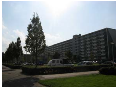
In het Pluspunt in de Edelstenenbuurt is een succesvolle ruimte voor en door jongeren

jongerenwerkers, zeer goed gebruik van maken. Sinds opening van dit centrum is de overlast in de nabije omgeving sterk gedaald.