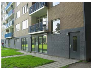
Plint met kelderboxen van de onlangs gerenoveerde Venusflat