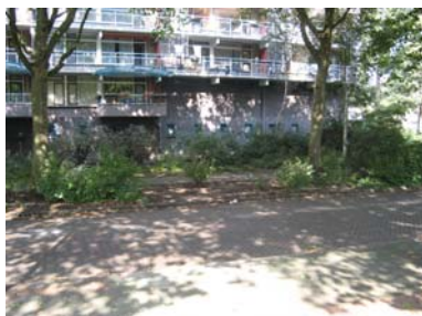
Dode plint in de Castorflat