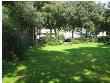
Ongedefinieerde plek aan de zuidkant van de Castorflat