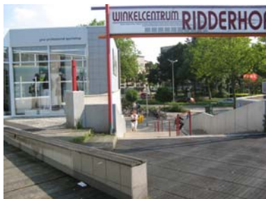
Nabijgelegen winkelcentrum Ridderhof