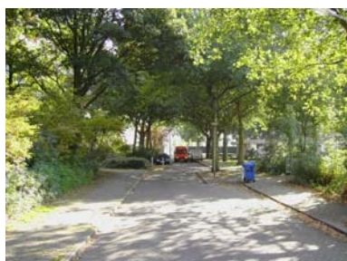
Door verwijdering van een deel van de grote bomen aan de Polluxstraat wordt het zicht op het centrale plein verbeterd