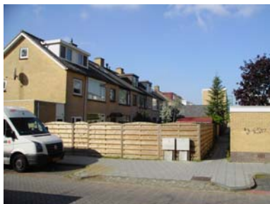
Laagbouw biedt een 'gesloten aanblik'