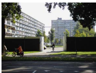
Doorsteek voor fietsers en voetgangers over de Kennedylaan naar de Edelsteenbuurt

Ad. A: Een goedkope maatregel, waarbij tevens de ongewenste bezoekers vanuit de Edelstenenbuurt worden geweerd. Echter zeer onvriendelijk tegenover alle huidige gebruikers, zoals schoolgaande jongeren die het achterliggende Scala College bezoeken.