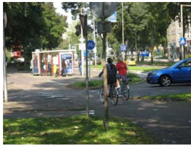
De ingewikkelde verkeerssituatie aan de Kennedylaan wordt verbeterd.